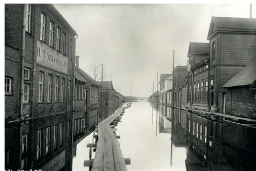
1920. aastad; foto: EKLA

Mida siis veel peale lume on tarvis, et sada kilomeetrit pikk Emajõgi laiutaks aprillis näiteks Kärevere silla all nagu järv, pressiks end Tartus tänavatele, Supilinna keldritesse, vangla külje alla ja lainetaks lhastesse viival kergliiklusteel nagu mullu kevadel?